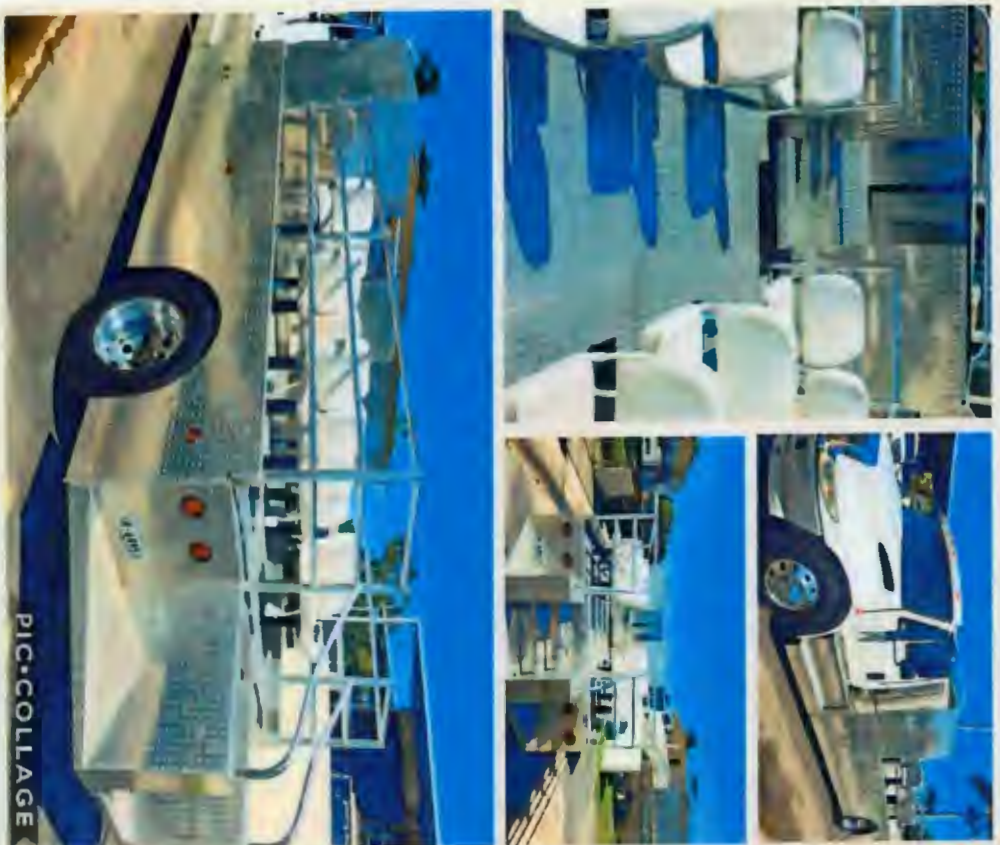
Camión para Prensa